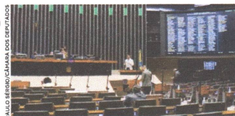
Projeto teve análise concluída nesta semana no Plenário Ulysses Guimarães, da Câmara Federal

deverão ter diretrizes para o uso da frota aeroagrícola. Para serem utilizadas nessas operações, as aeronaves deverão atender às normas técnicas definidas pelo poder público e ser pilotadas por profissionais qualificados para a atividade. De acordo ainda com a proposta, a política de emprego da aviação agrícola na atividade de combate a incêndio em todos os tipos de vegetação seria proposta pelo Ministério da Agricultura, Pecuária e